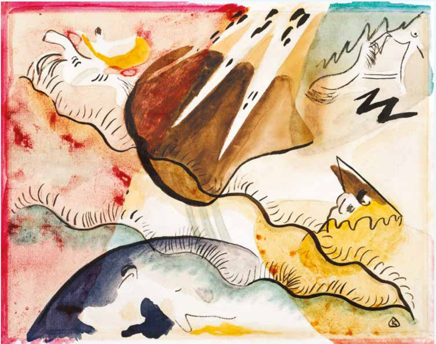
Rain Landscape , Wassily Kandinsky, 1911